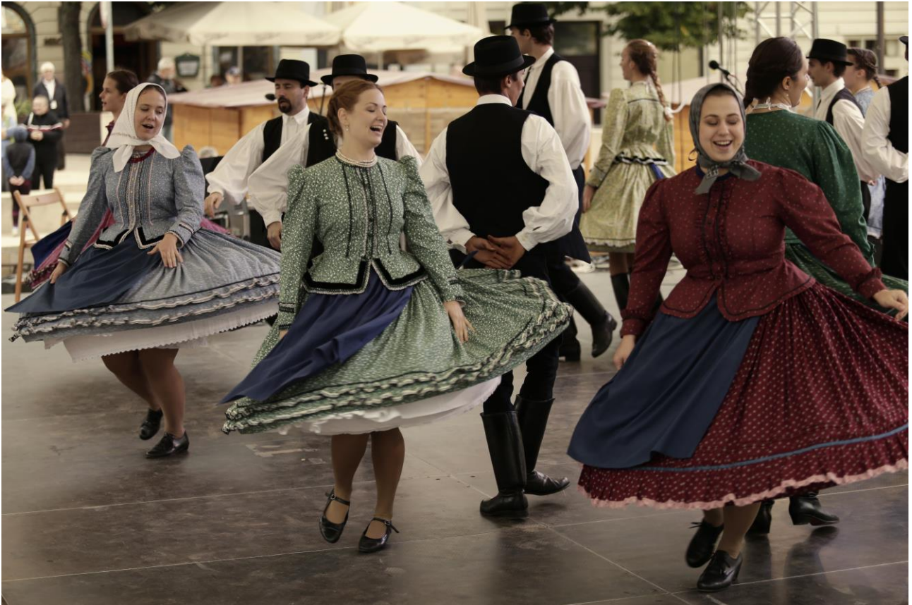
Mecsek Táncgyűttes – Pécs, Széchenyi tér