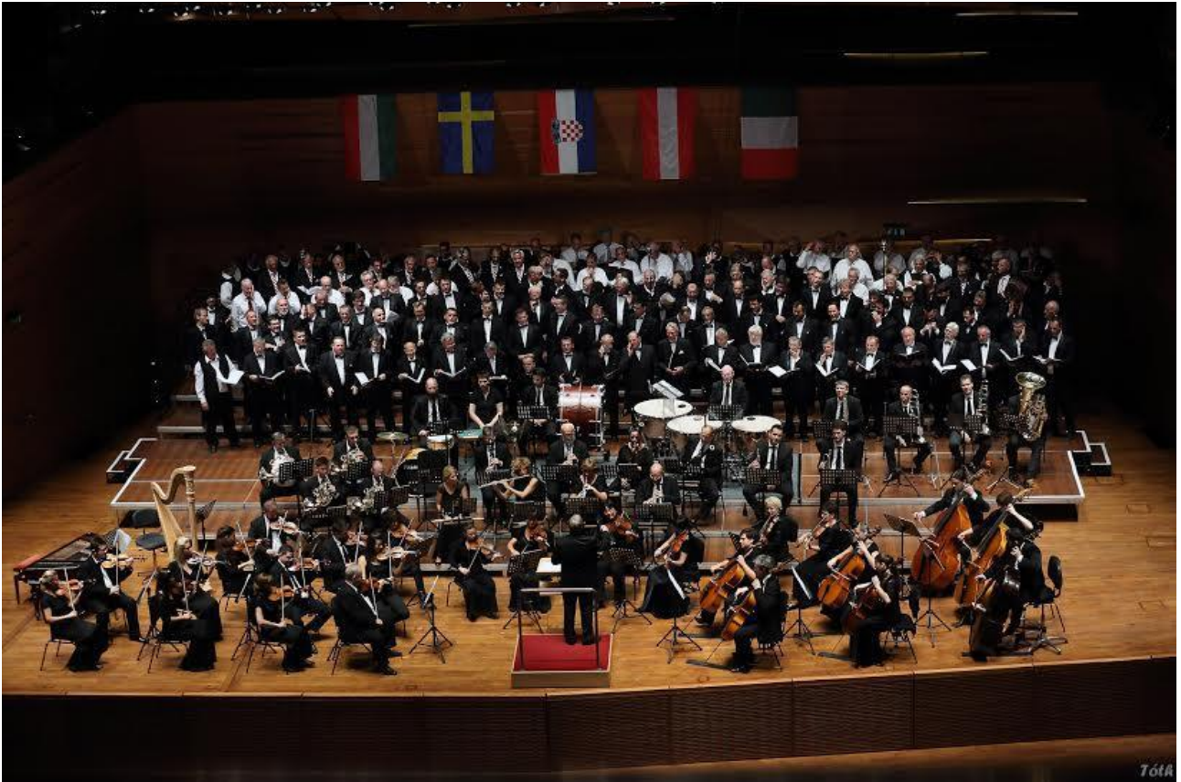
Összkar és a Pannon Filharmonikusok – Pécs, Kodály Központ