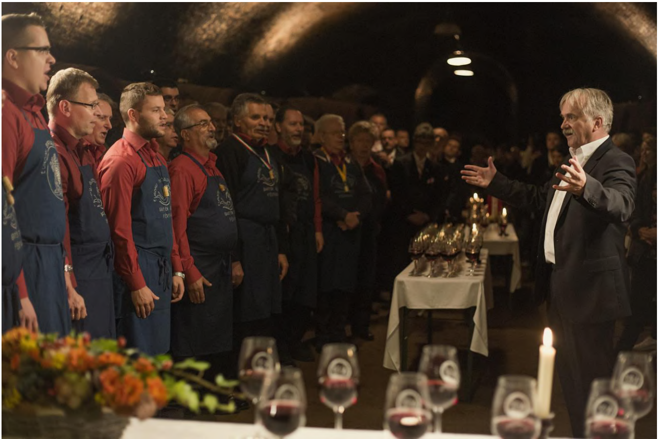
Bartók Béla Férfikar a Batthyány Pincében (megnyitó)