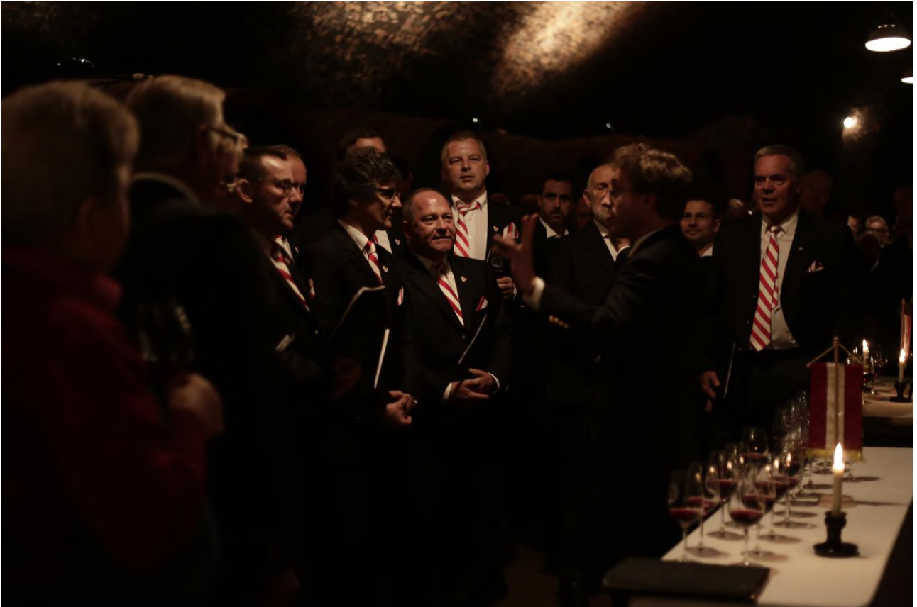
Sangerrunde Kritzensdorf (Ausztria) – Batthyány Pince