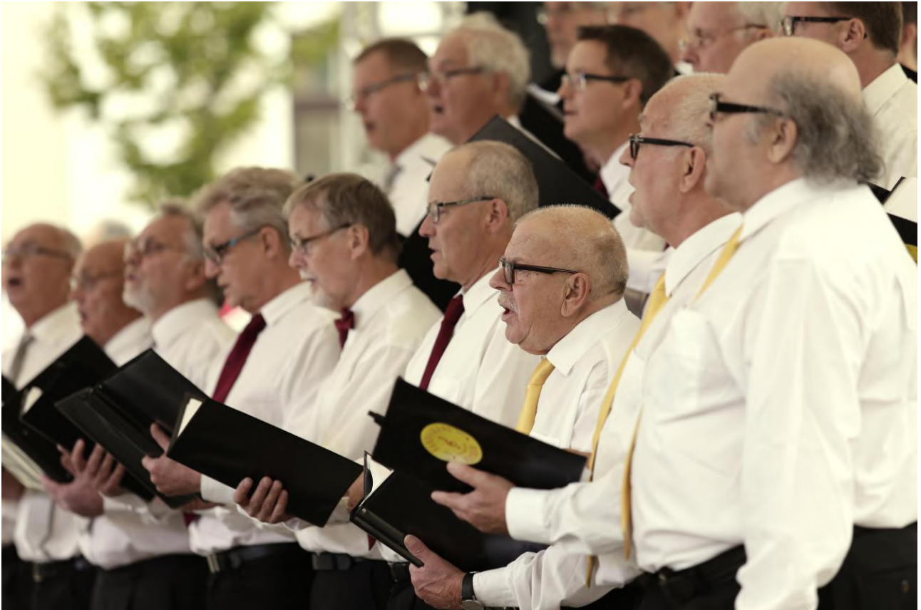
Sandviken Male Choir (Svédország) – Pécs, Széchenyi tér