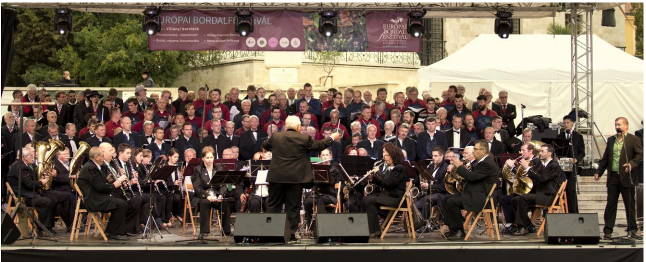
Bartók Béla Férfikar és az Ércbányász Koncertfúvószenekar – Pécs, Széchenyi tér