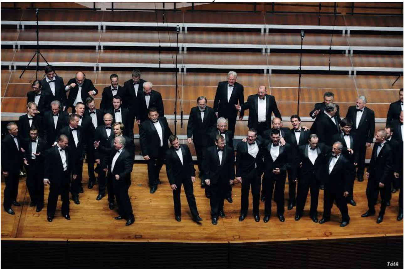
Bartók Béla Férfikar – Pécs, Kodály Központ