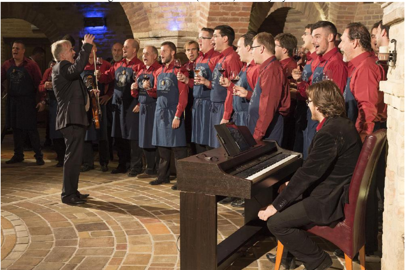
Bartók Béla Férfikar Pincekoncertje – Villány, Bock pince