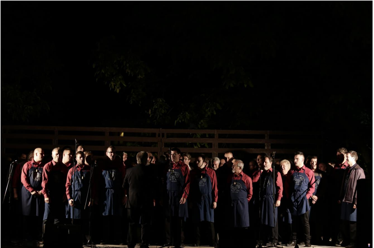
Összkar – Villány Diófás tér